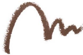
EX04 Shimmering Shade 限定