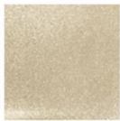
EX52 Sandglass 限定