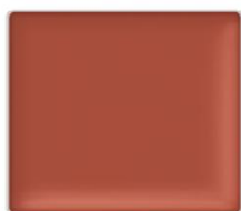
EX03C Mellow Glow 限定