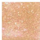
EX53 Prismatic Shine 限定

透明感のあるオレンジベージュと ガラスパールがみずみずしい プリズマティックシャイン