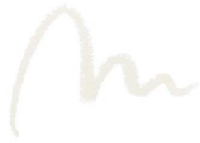
EX03 Fusing Light 限定