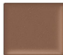
EX05C Modernity Shade 限定