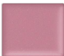
EX04C Cold Bloom 限定