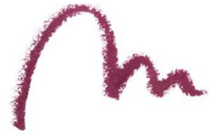
EX05 Deep Beets 限定