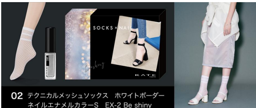
02 テクニカルメッシュソックス ホワイトボーダー ネイルエナメルカラーS EX-2 Be shiny