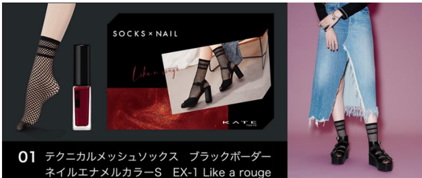
01 テクニカルメッシュソックス ブラックボーダー ネイルエナメルカラーS EX-1 Like a rouge

・テクニカルメッシュソックス 1足入り (サイズ 23~25cm) ・ネイルエナメルカラーS 1個