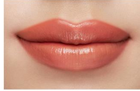
仕上がり イメージ