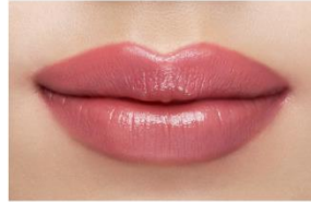
仕上がり イメージ