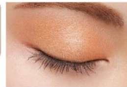
MB003 マーブルオレンジ