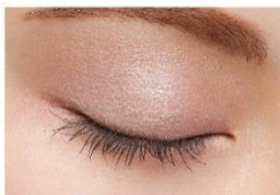
MB001 マーブルブラウン