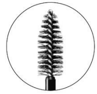
とかしやすい 大きめブラシ

自分だけの組み合わせや使い方、もっと自由に。 無限に生まれる“欲”を満たす、ザ アイカラーから 新タイプのマーブルインクが登場。 3色が複雑に混ざり合い、 ひと塗りで奥行きのある目もと印象へ。