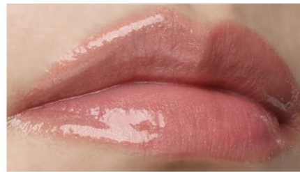
ラスティングプランプリップスティックを塗布した唇

ラスティングプラン処方と巧みな色設計の効果で、くすみが気になる唇も、ふっくらボリューム感のある仕上がり。つややかな美膜に覆われた立体感を演出します。