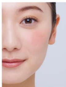
EX4 Pursue your passion