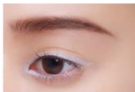
EX1 It's never too late to change yourself