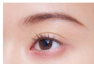
EX5 Every night comes to an end