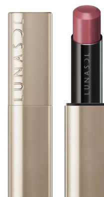
01 Savage Bordeaux