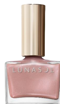
EX34 Rosy Dust