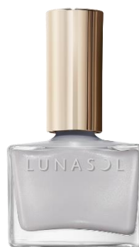
EX33 Marble Gray