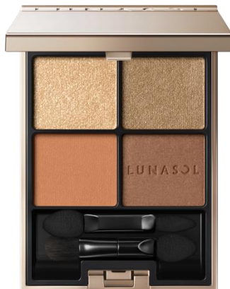
18 Sepia Amber