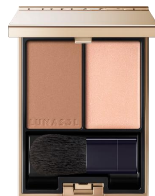
EX08 Muted Glow