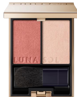
01 Savage Bordeaux