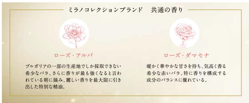
イラストは香りのイメージです