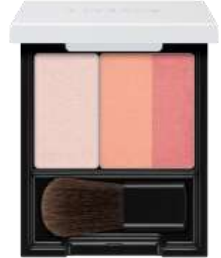
RS1 エレガントローズ PK1 イノセント