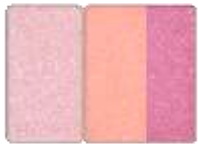
ピンク BE1 モダンベージュ

レフィル 3種 各3,300円（税込） ケース（ブラシ付） 1,100円（税込）