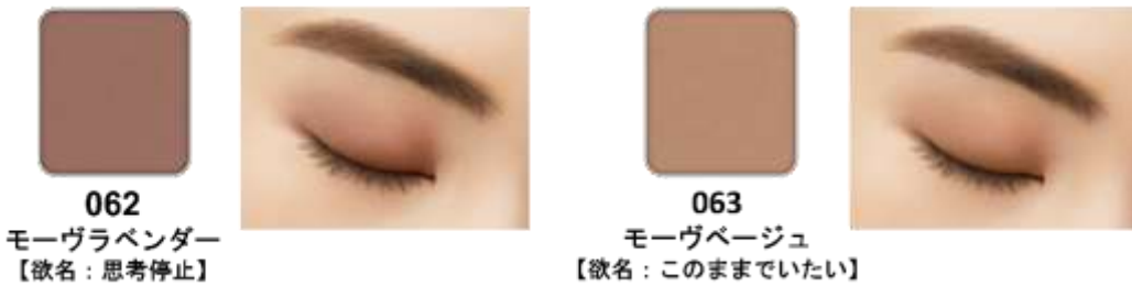
全て仕上がりイメージ

さらっと軽やかな抜け感ニュアンスカラーが2色加わります。どちらもマットな質感で、「062」のモーヴラベンダーはシックな印象に、「063」のモーヴベージュは、さりげない陰影感を演出します。「ザ アイカラー」には、それぞれ欲名（062:思考停止、063:このままでいたい）がつけられており、なりたい仕上がりから色を選ぶだけでなく、全108色から自分にピッタリの欲名を見つけて、オリジナルの組み合わせを楽しめます。