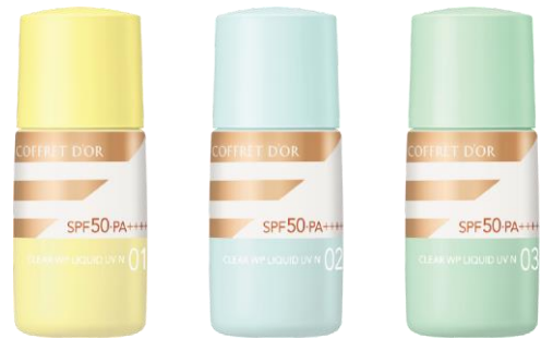
01（オークル-B 相当） 02（オークル-C 相当） 03（オークル-D 相当）

2019年の夏より発売を開始し、例年好評をいただいている多機能ファンデーションが、今年も数量限定で再登場いたします。コンパクトなひと夏使いきりサイズです。