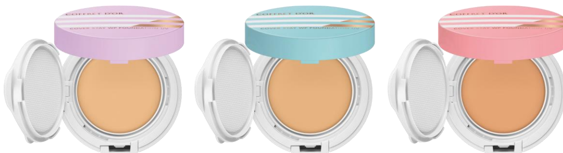
01 (オークル-B 相当)