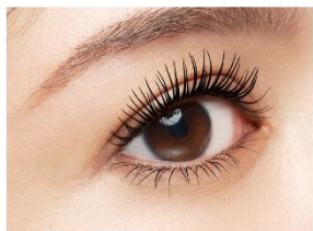
仕上がりイメージ