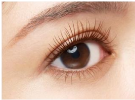
仕上がりイメージ