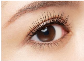
仕上がりイメージ