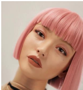
仕上がりイメージ

使用アイテム： 「ケイト パウダリー スキンメイカー 02」 「ケイト ホワイトシェイビングパレット WT-1」