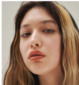
仕上がりイメージ

使用アイテム： 「ケイト シークレット スキンメイカー 01」 「ケイト ホワイトシェイビングパレット WT-1」