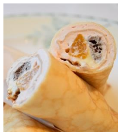
子ども達と開発したクレープ 左上から 『カシスアメジスト』 『エメラルドグリーンティー』 『オレンジガーネット』