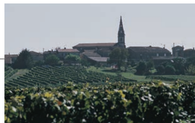
シャトー・ムートン・ロスチャイルド