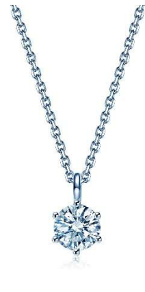
サンプル:ネックレス