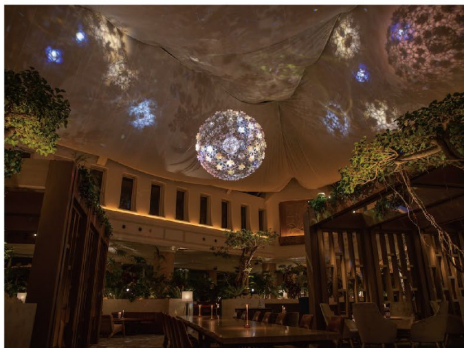
[写真左：YAMBARU ART FESTIVAL 2022-2023 出展作品 IJU CHANDELIER]

やんばるの山々に咲く沖縄固有種の“イジュ”をモチーフにした作品。イジュのみずみずしくもたくましい生命力とやんばるの雄大な自然を約 2m のステンレス製の球体とティップアート作られた樹脂製の花で表現しています。