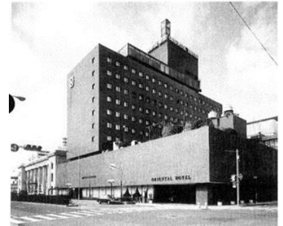
▲旧オリエンタルホテル

オリエンタルホテルは何度も移転を繰り返し、1964年（昭和39年）には京町25番地へ移転。その際、第5代社長に就任していた日本郵船の安部正夫氏が、“港街・神戸のシンボルに”という想いのもと、日本で初めてホテルの敷地内に建つ公式灯台が設置されました。1995年（平成7年）1月17日に阪神淡路大震災が発生し、ホテルは全壊、営業停止となりました。