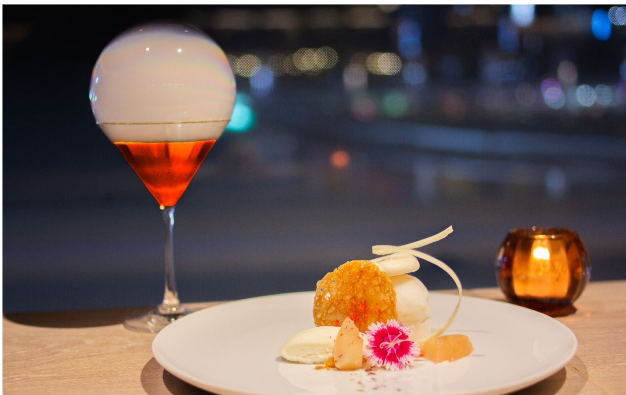
※写真のスイーツはアシェットデセール

オリエンタルホテル福岡 博多ステーション（所在地：福岡市博多区）では、2024年8月24日（土）に「ナイトスイーツbuffet」を開催いたします。毎回ご好評いただいているスイーツbuffetを、ちょっと贅沢なメニューでカクテルタイム（第一部 18:30～20:00 第二部 20:30～22:00）に特別開催。博多駅前を一望できる全面をガラスに囲まれたカジュアルでお洒落な店内で、ホテル自慢の手作りスイーツの数々を心ゆくまでご堪能いただけます。「宮崎マンゴアの薔薇タルト」や「桃とアールグレーのロールケーキ」をはじめ、当ホテルパティシエが実演で仕上がる「アシェットデセール」など、当店の人気商品やお酒にぴったりのスイーツまで、幅広いバリエーションをご用意いたします。さらに「スズキのパイ包み」や「和牛のローストビーフ」などホテルメイドの贅沢フードメニューまで大充実の内容でお届けいたします。いつもよりワンランク上の、ちょっぴり大人で贅沢なスイーツbuffetをお楽しみください。