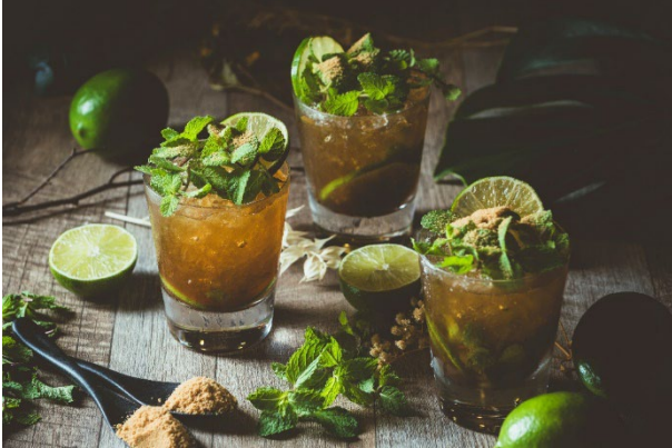
※やんばるモヒート

詳細はこちら: https://okinawa.oriental-hotels.com/news/415/