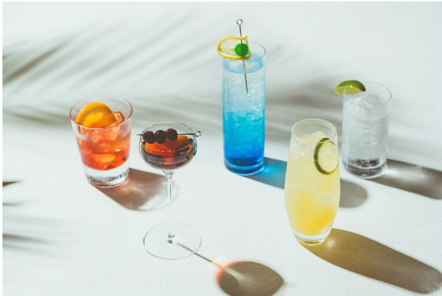
※「OKINAWA セレクション」イメージ

「島とあそび 森とつながる」をコンセプトに、沖縄本島北部、亜熱帯の豊かな森と碧い海が広がる「やんばる」の入口に位置するオリエンタルホテル 沖縄リゾート&スパ(沖縄県名護市)は、ホテルが目指す「県産食材へのこだわりと、沖縄の魅力発信」の想いを込め、ロビーラウンジで提供しているドリンクメニューを一新し、やんばるに焦点を当てたカクテルメニューが味わえる「OKINAWAセレクション」を、2023年10月1日(日)より提供開始いたします。