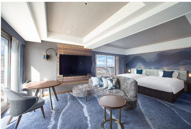
▲客室一例「エグゼクティブコーナーツイン」

館内には、神戸らしい風景を眺めながらお食事がお楽しみいただける4つのレストランをご用意。最上階に位置し、パノラマに広がる絶景夜景と共に銘酒が楽しめる「VIEW BAR」や、港らしい風景を眺めながら神戸ビーフをはじめとする美食をご堪能いただけるステーキハウス「オリエンタル」など、さまざまなご利用シーンで神戸らしい唯一無二のホテルステイをご提供いたします。