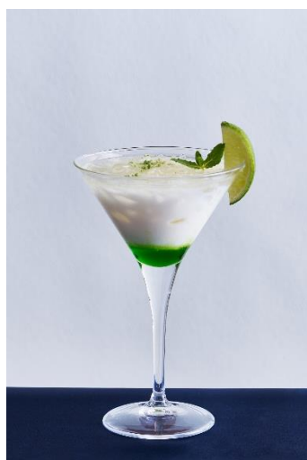
愛島セシル 1,450 円

パッションフルーツシロップ、生姜シロップ、 ソーダ、グレナデンシロップ、ミルク、 ピンクグレープフルーツ、ミント