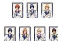
トラベルステッカー(ランダム 7 種) 500 円(税込 550 円)