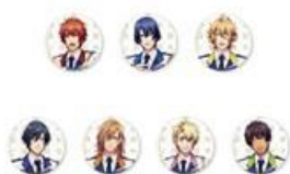
缶バッジ(ランダム 7 種) 500 円(税込 550 円)