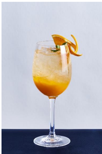
神宮寺レン 1,450 円

さくらシロップ、ヨーグルト、 グレープフルーツジュース、パタフライピーシロップ、 エディブルフラワー、ブルーベリー