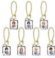
バッグチャーム(全 7 種) 1,500 円(税込 1,650 円)