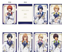
A4 クリアファイル(ランダム 7 種) 500 円(税込 550 円)