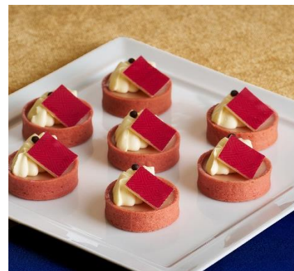
【来栖 翔】 翔の好吃(ハオチー)フルーツタルト