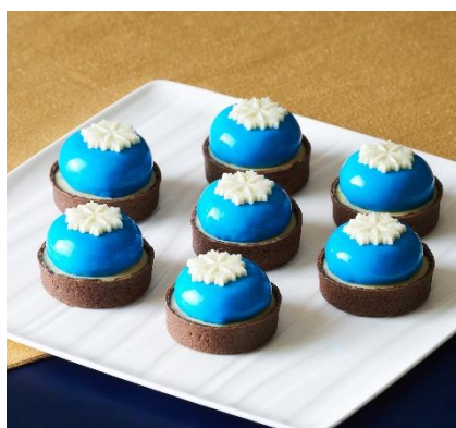
【聖川真斗】 真斗のスノーブルーベリータルト