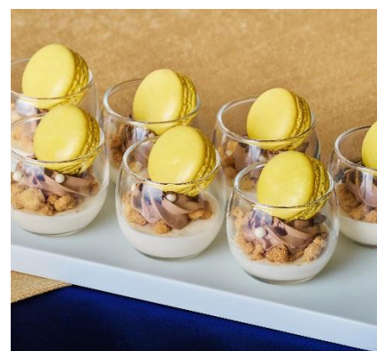
【四ノ宮那月】 那月のマカロンサンドのヴェリーヌ仕立て