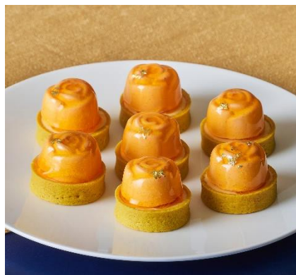
【神宮寺レン】 レンのタルタディローザ