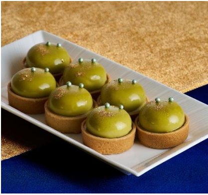
【愛島セシル】 セシルのタルトヴェールピスターシュ