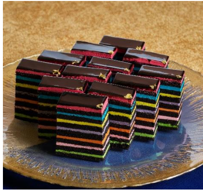
【ST☆RISH】 ST☆RISHのレインボーオペラ