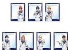
アクリルカード(ランダム 7 種) 700 円(税込 770 円)