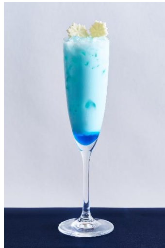
聖川真斗 1,450 円

パッションフルーツシロップ、生姜シロップ、ソーダ、 ストロベリーシロップ、クランベリージュース キンギョソウ、フランボワーズアイス、いちご