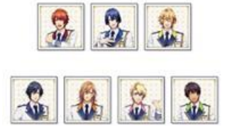
ハンカチ(全 7 種)※通販限定 1,000 円(税込 1,100 円)