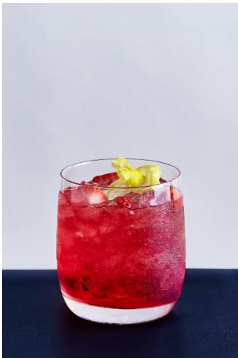
一十木音也 1,450 円

パッションフルーツシロップ、生姜シロップ、ソーダ、 ストロベリーシロップ、クランベリージュース キンギョソウ、フランボワーズアイス、いちご