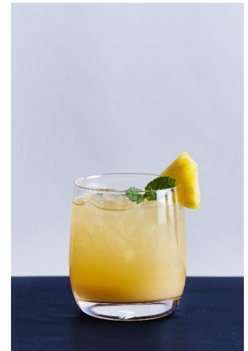
四ノ宮那月 1,450 円

さくらシロップ、ヨーグルト、グレープフルーツジュース、 ブルーシロップ、ホワイトチョコレート