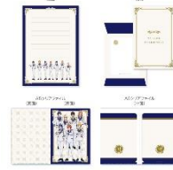
レターセット 900 円(税込 990 円)