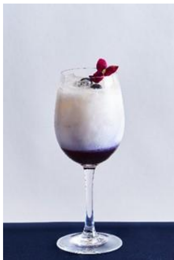
一ノ瀬トキヤ 1,450 円

さくらシロップ、ヨーグルト、 グレープフルーツジュース、パタフライピーシロップ、 エディブルフラワー、ブルーベリー