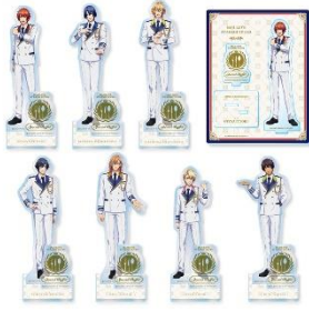
アクリルスタンド(全 7 種) 1,400 円(税込 1,540 円)