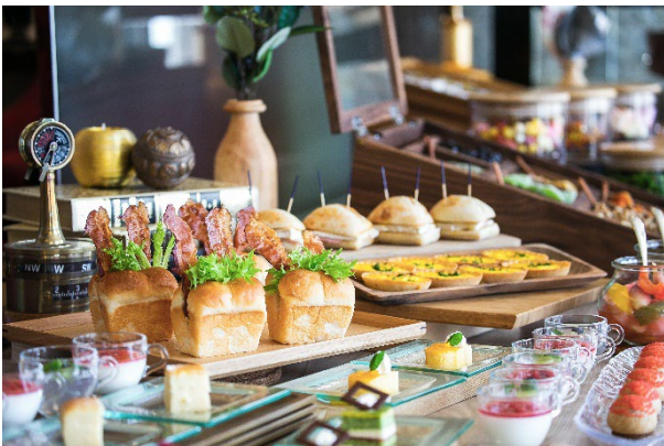
[アフタヌーンティーイメージ]