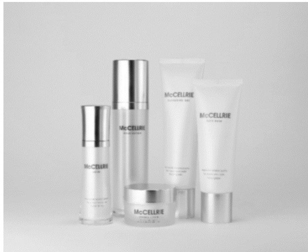
【フェイシャルコースコスメ マクセリーシリーズ】

「リトリートステイKOBE春夏」は、バルコニーから神戸の街が一望できるエグゼクティブルームで、質の高いトリートメントコースをご同伴者さまと2名同時にお受けいただける春夏限定の宿泊プランです。ウエルネスエステサロン「Vivo Tesera」（ホテル5F）より熟練のセラピストがお部屋にお伺いし、本プラン用にご用意した特別メニューをオールハンドで施術いたします。トリートメント内容は、オーガニック認定されたアロマオイルで全身のリンパの流れと凝り固まった頭の筋肉をほぐすボディトリートメントコース（各90分）と、ヒト幹細胞コスメ「マクセリー」の化粧品を使ったフェイシャルコース（各90分）からお選びいただけます。がんばった自分へのご褒美として、寛ぎと癒しのプライベート空間で、リラックスしながら心とからだを潤すリトリートステイをご提案いたします。