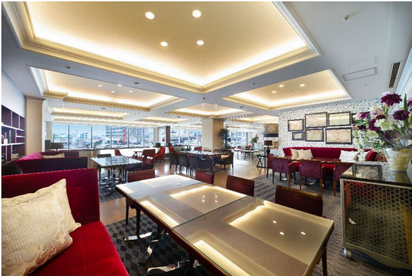
[エグゼクティブラウンジ]