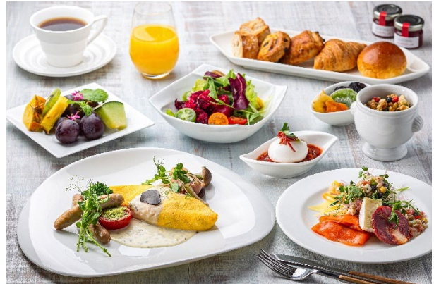
[エグゼクティブラウンジ 朝食イメージ]