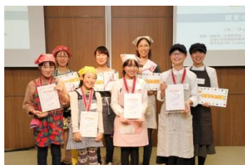
全国大会へ出場される参加者