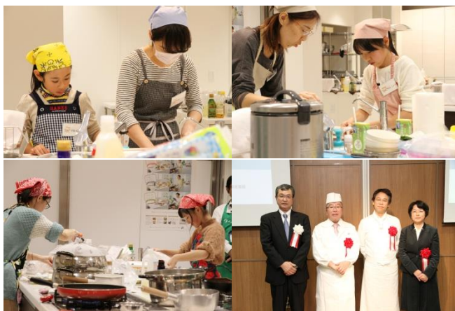
入賞者の調理の様子と審査員