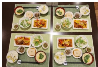
優勝のお料理：「千葉の秋を食卓に・・・」