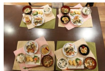
準優勝のお料理：「我が家のトリプル巻き〜 〜だし巻き〜♡さん巻き〜♡ 真っ黄き〜のさつまいも〜」