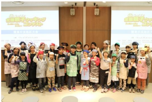
第9回参加者のみなさん