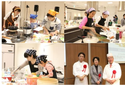
第9回入賞者の調理の様子と審査員