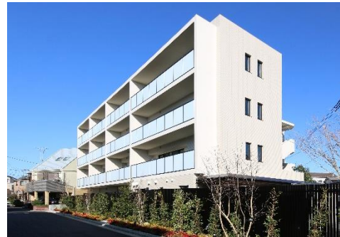
JP noie 練馬旭丘