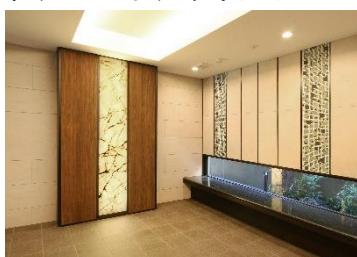
住宅エントランス