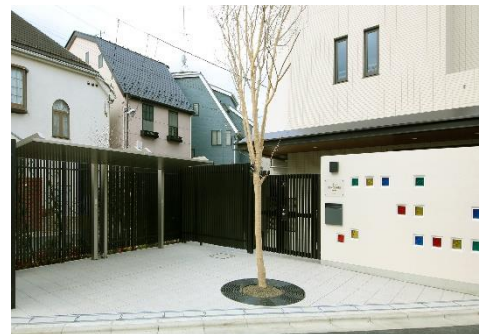
ベネッセ 練馬えこだ保育園