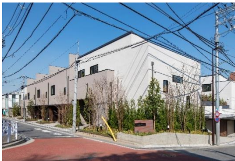
JP noie 広尾 The Residence