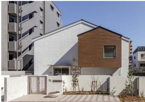
にじいろ保育園北砂

「JP noie」ブランドによる賃貸住宅としては計10棟、当社が建設した保育所としては、計5施設となります。詳細は別紙のとおりです。