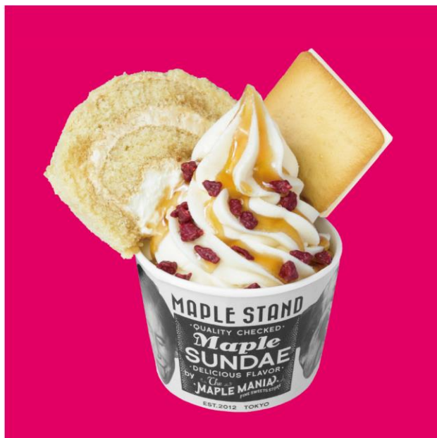
〈メープル ラズベリー〉 750円（税込）