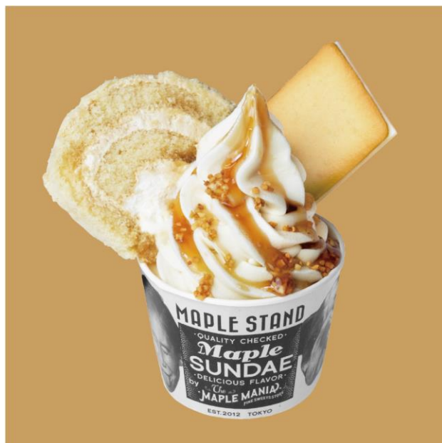
〈メープル ナッツ〉 750円（税込）