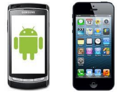
[スマートフォン向けブラウザアプリ]