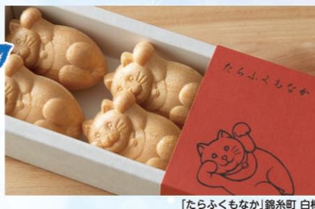
「たらふくもなか」錦糸町 白樺