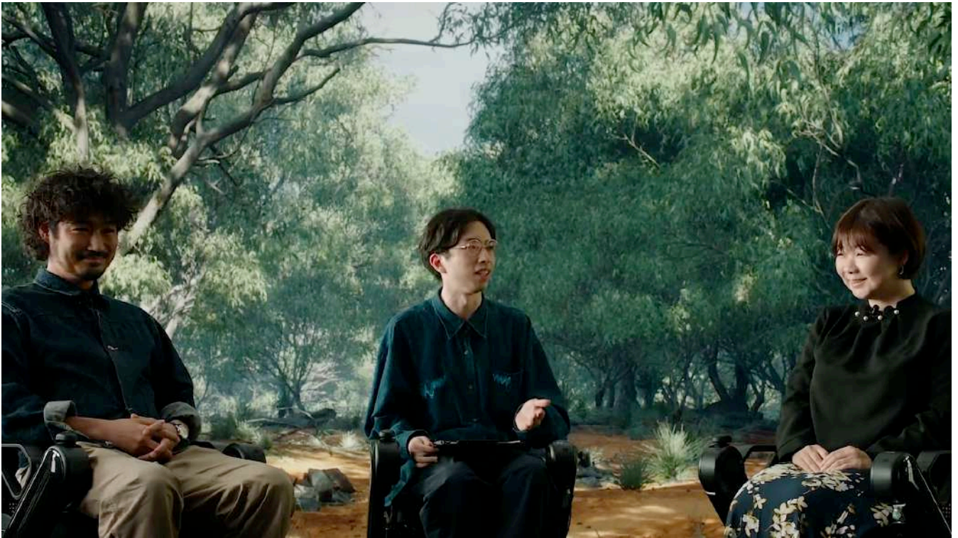
トーク内容に合わせて椅子と背景を動かす