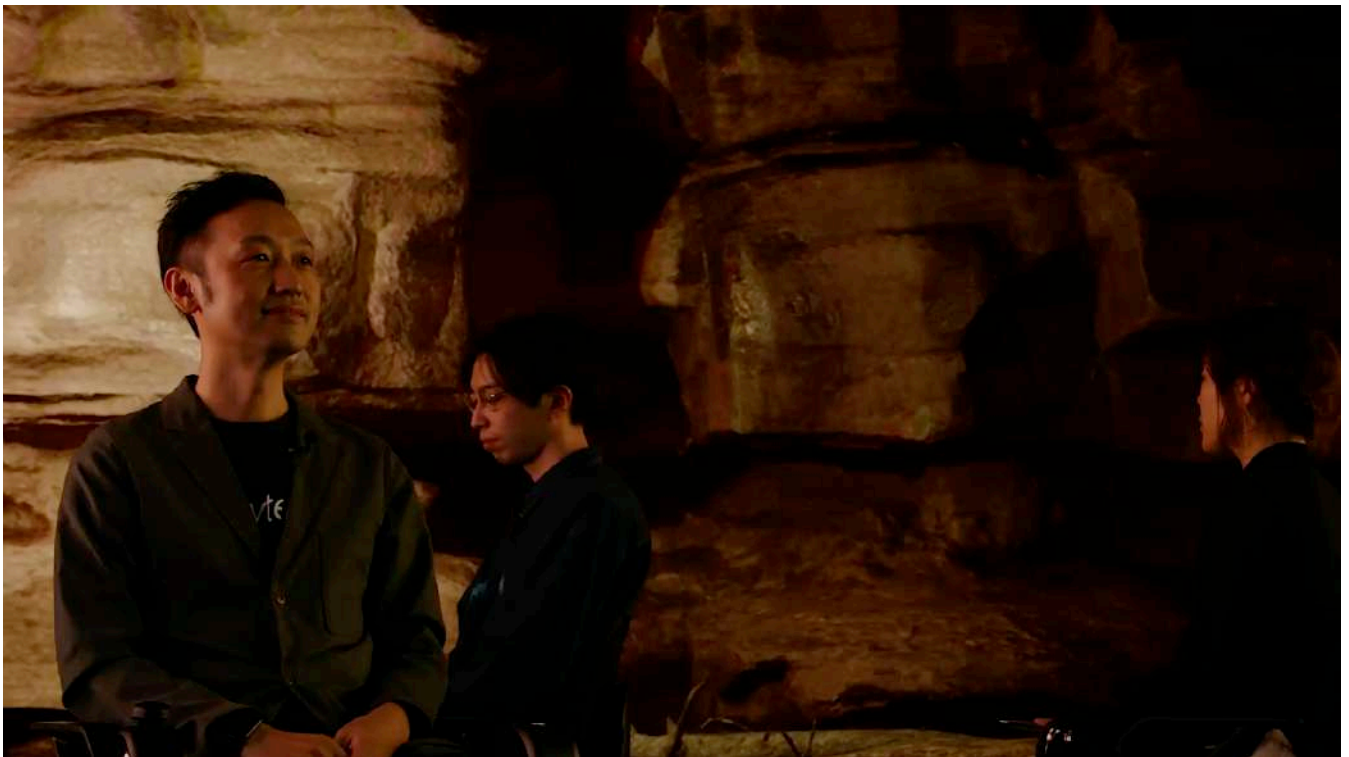
座る位置を入れ替えるために、椅子と背景を360度回転させる