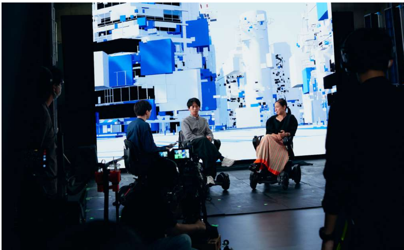
LEDウォールのCG映像と空間照明のライティングを連動したトークシーン

さらに、このシステムを採用・実装する会場・設備づくりも注力していきます。ドバイやマカオなど絢爛なスタジオでのパフォーマンスや、国内外の放送局・ライブスタジオの設置など、新たな映像表現と視聴体験を実装し、バーチャルプロダクションの概念をさらにアップデートする協業パートナーを募集しています。