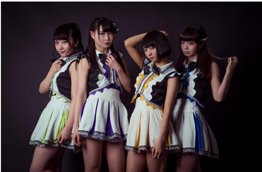
強がりセンセーション