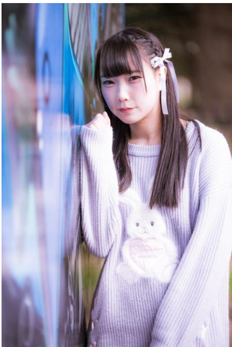
市川結愛 (強がりセンセーション)