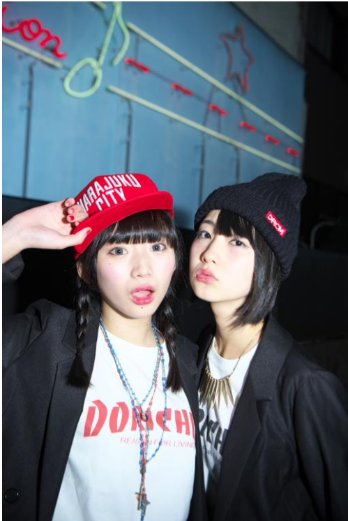
Special Deals (ジュネス☆プリンセス)