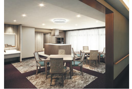
キッチンサロン（いずれも完成予想 CG）

・モダンで潇洒な佇まいと上質な住空間。格式高いインテリアや装飾デザインを取り入れながら、シンプルかつモダンな要素を融合させた住空間。