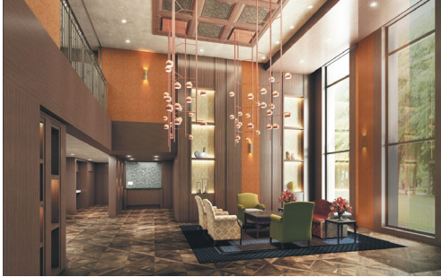
アリア護国寺 エントランスラウンジ