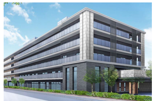
アリア護国寺 外観（完成予想CG）