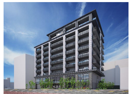
メディカル・リハビリホームグランダ水前寺／外観イメージ図