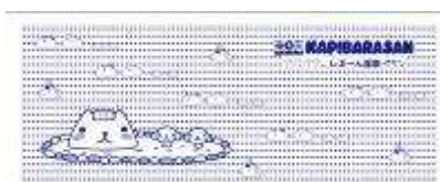
カピバラさん 特製てぬい