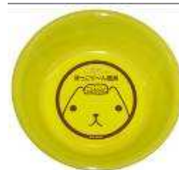
カピバラさん特製 ほっこり〜ん温泉桶