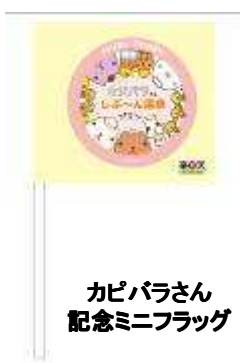
カピバラさん 記念ミニフラッグ