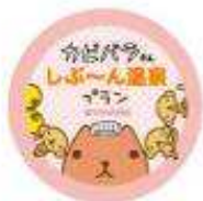
カピバラさん 缶バッチ