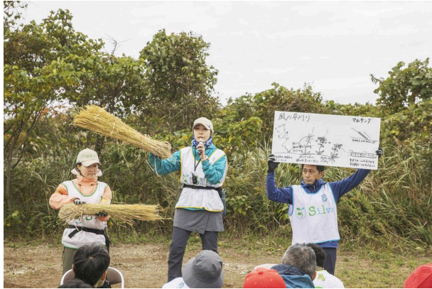
育樹祭の体験の内容をご紹介します