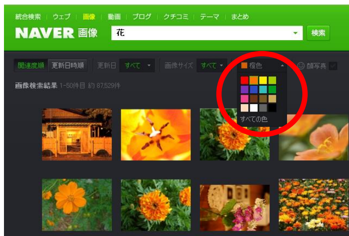
カラーフィルター（オレンジ色指定の例）

なお、絞り込み指定が可能な色は「赤」、「オレンジ」、「黄」、「黄緑」、「緑」、「水色」、「青」、「紫」、「ピンク」、「こげ茶」、「うす茶」、「ベージュ」、「クリーム」、「白」、「グレー」、「黒」と業界最大級（当社調べ）の16色となります。