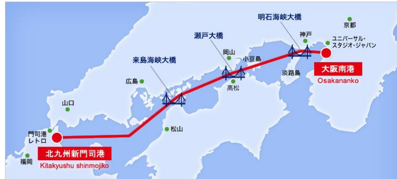
大阪南港⇔新門司港の直行便