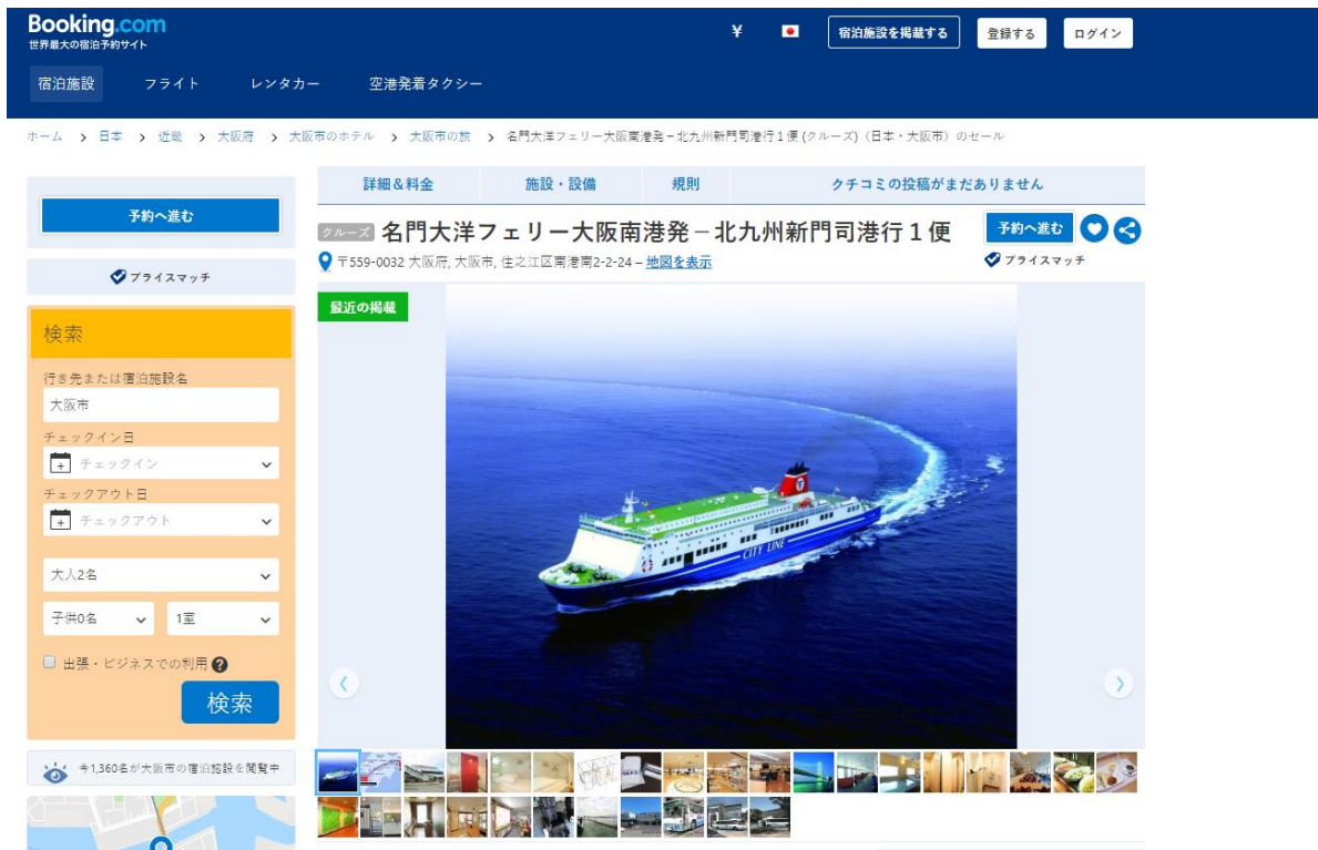
※掲載ページイメージ