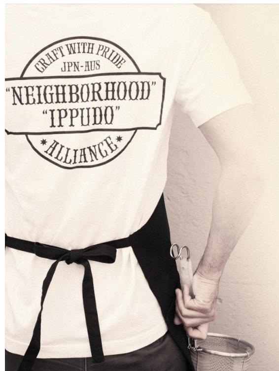
ヴィジュアル写真⑤