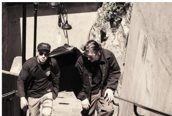
ヴィジュアル写真③