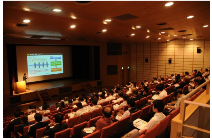
▲10月19日（月）名古屋会場