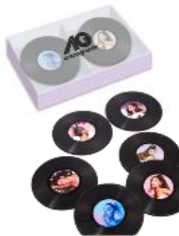
コースターセット (1セット6コ入り)