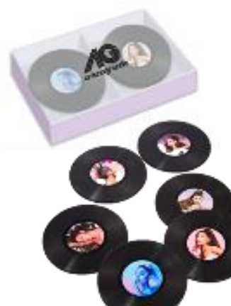
コースターセット (1セット6コ入り)