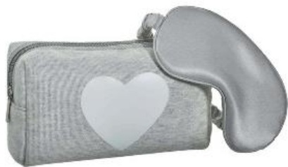
スリープマスク&amp;ポーチセット