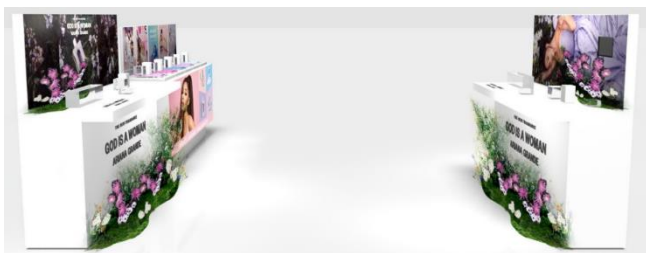
@cosme TOKYO特設売り場 ※画像はイメージです。 変更の可能性がございます。