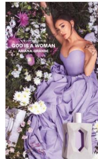
ゴッドイズアウーマンカード