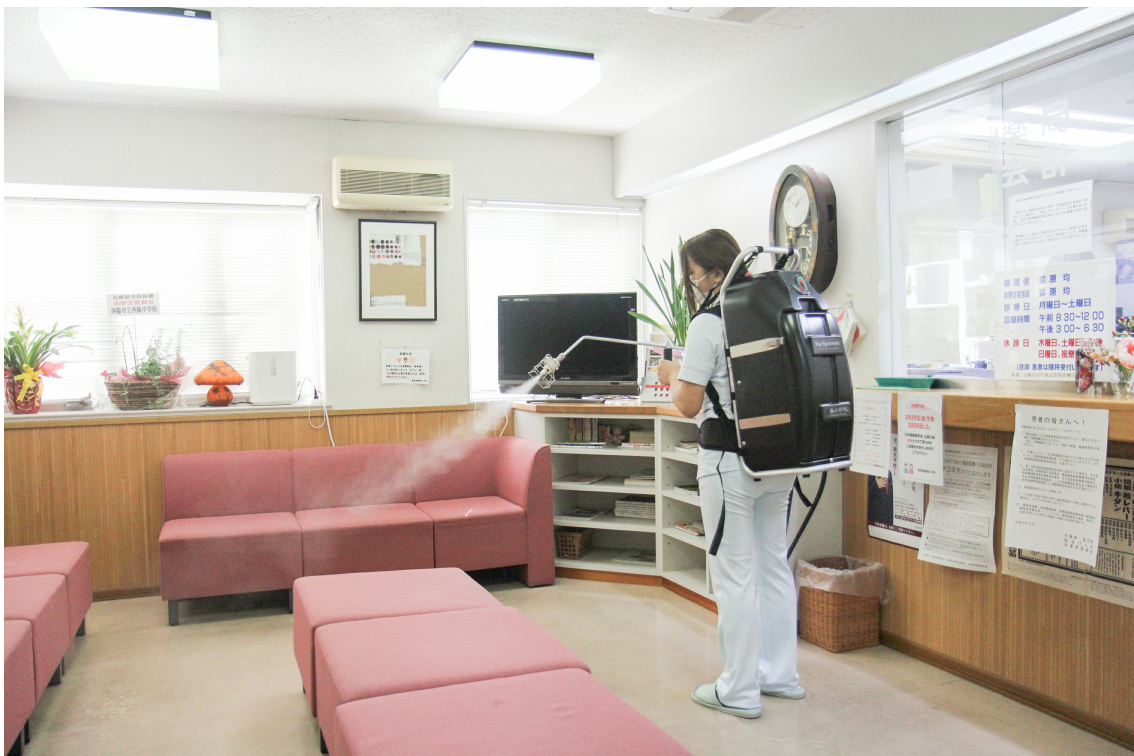
病院での使用風景

本体には1回の充電で40分稼働可能なリチウムイオン電池を内蔵しているため、電源ケーブルの取り回しや電池切れを気にすることなく使用できるほか、背負い部のハーネスやパッドは長時間作業時の負担を軽減するためバランスの良さを追求した人間工学設計となっています。