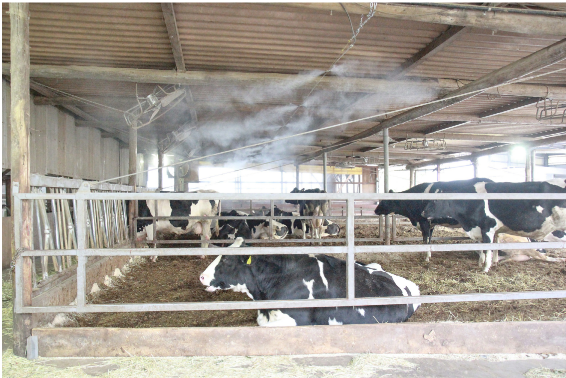
畜舎冷房・薬液散布システム「CoolPescon」