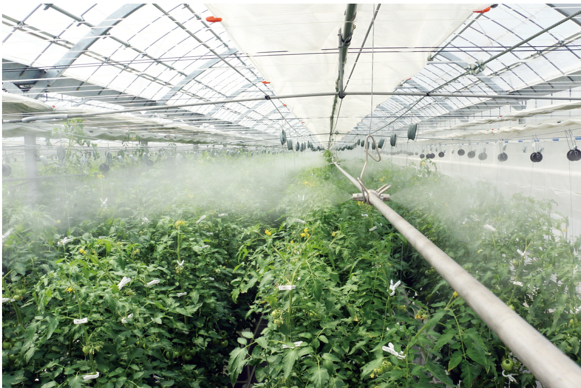
冷房加湿・葉面散布・薬液散布システム「CoolPescon」

株式会社いけうちでは、この他にも、農畜産施設における暑さ対策、呼吸器疾病・病虫害対策を目的とした自動スプレーシステム「CoolPescon」や、施設入り口における薬液充満ブース「防除ブース」など、スプレーノズルメーカーとして培った微粒化技術を活かした製品を開発、販売しております。