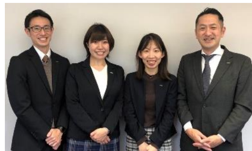
HRサポート課のメンバー

プレスリリースに掲載されている情報は、発表日現在の情報です。その後予告なしに変更されることがございますので予めご了承ください。