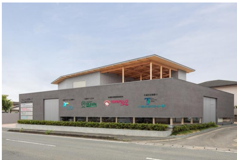
(新オフィス完成 2023年4月)

多様なライフスタイルを持つ女性が、仕事と家庭を両立できる社会の実現を目指します。