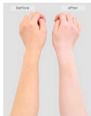
赤みよりの肌に使用した場合