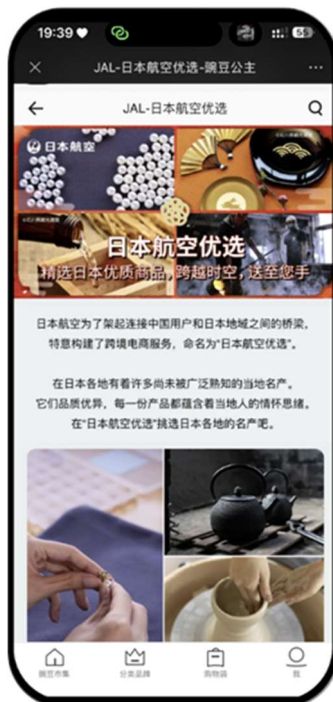
豌豆アプリ内の「日本航空優選」のページデザイン

インアゴーラが強味とするライブコマースを活用し、地域の特産品の情報を発信することで JAL および地域の特産品の認知度拡大と販売促進に繋がります。また、帰国後の豌豆アプリでの越境 EC を活用した購入へと誘導します。