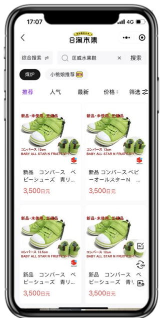
AI 検索機能の画面イメージ