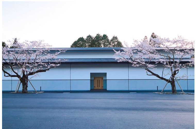
天猫「豌豆公主酒水旗舰店」の天賦紹介画面キャプチャと西酒造の日本酒蔵全景

西酒造は、1845年に創業し、名門焼酎「富乃宝山」「吉兆宝山」「天使の誘惑」などで知られる名高い酒蔵です。約180年にわたり培ってきた醸造技術を活かして、2019年より南半球の島国・ニュージーランドでワイン造りを開始、同年に、錦江湾と御岳（桜島）を望む丘の上にある御岳蒸留所でジャパニーズウイスキー造りを開始しました。さらに、2020年より日本酒造りを開始しています。焼酎のみにとどまらず、ワインの「URLAR」、ジャパニーズウイスキー、日本酒の「天賦」を手掛ける稀有な酒蔵です。焼酎造りと同様に「農業」を大切に、自然界に息づく「ことわり」と伝統を受け継ぐ職人の「こだわり」を含めた日本酒造りを行っており、「天賦」の販売開始から3年未滿にも関わらず、日本酒専門WEBメディア「SAKETIMES」の全国ランキング82位、鹿児島ランキング1位を獲得している注目度の高い酒造会社です（2023年7月12日現在）。