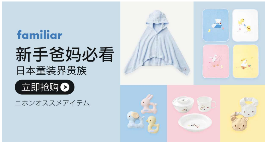
取り扱い商品（一部）

インアゴーラは、今後もより多くの日本商品を中国のお客様に紹介し、日本の商品とライフスタイルを楽しんでいただく場をお届けします。