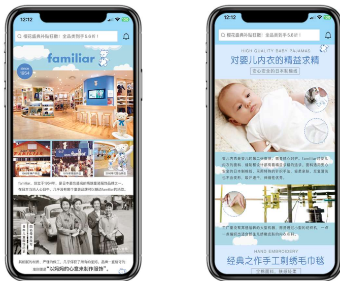
ファミリアのブランドページデザイン

このたび新たにファミリアを取り扱うことで、ベビー&キッズアイテムの選択肢が大幅に増え、親子のライフスタイルの充実を図ることができると考え、提携に至りました。インアゴーラが構築してきた一連のマーケティングと販売の展開フォーマットを生かして、多角的にファミリアの中国展開をサポートしてまいります。