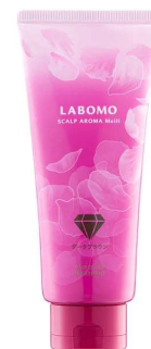
ラボモ スカルプアロマ ヘアカラートリートメント

インアゴラは、今後もより多くの日本商品を中国のお客様に紹介し、日本の商品とライフスタイルを楽しんでいただく場をお届けします。