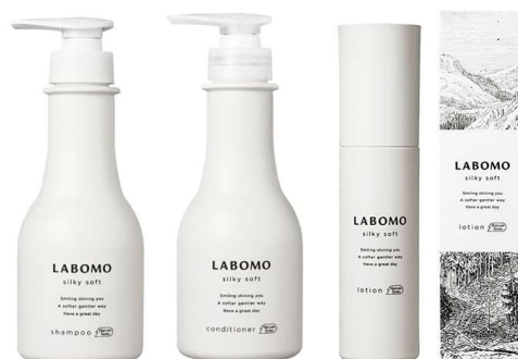
ラボモ シルキーソフトシリーズ