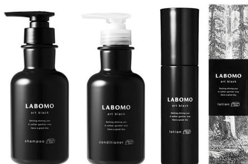
ラボモ アートブラックシリーズ