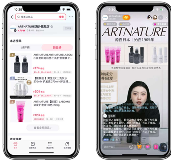
「アートネイチャー海外旗艦店」トップページキャプチャとKOLによるライブの様子

このたび旗艦店開設に至ったアートネイチャーは、1967年の設立以来、トータル・ヘアコンサルタント企業として業界をリードしています。ウィッグ製作や増毛・育毛サービス、理・美容サービスなど、お客様の毛髪に関するあらゆるニーズに対応する質の高いサービスラインナップを確立しています。近年は毛髪に関するノウハウを活かし、自社のヘアサロン向けに独自開発してきたシャンプー・コンディショナー、育毛剤等のヘアケア商品等の販売を国内外のEC市場にて展開しています。