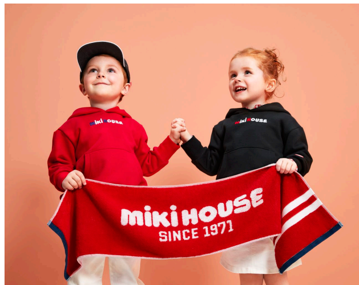
「MIKI HOUSE 海外旗艦店」での取り扱い商品 (一部)

インアゴラは、今後もより多くの日本商品を中国のお客様に紹介し、日本の商品とライフスタイルを楽しんでいただく場をお届けします。